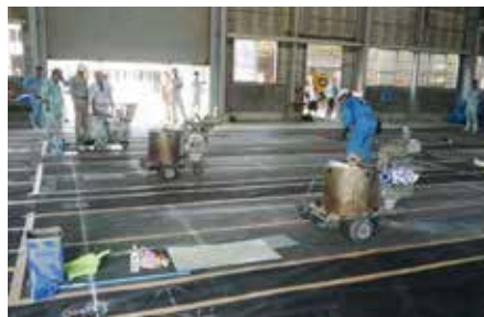
技能検定実技試験実施風景

平成 26 年一般社団法人化して変化する社会情勢に適確に対応し、専門業者として資質向上に努め、信頼される協会として安心安全な社会資本整備に貢献して参ります。