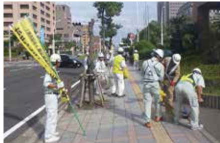
ボランティア活動の実施